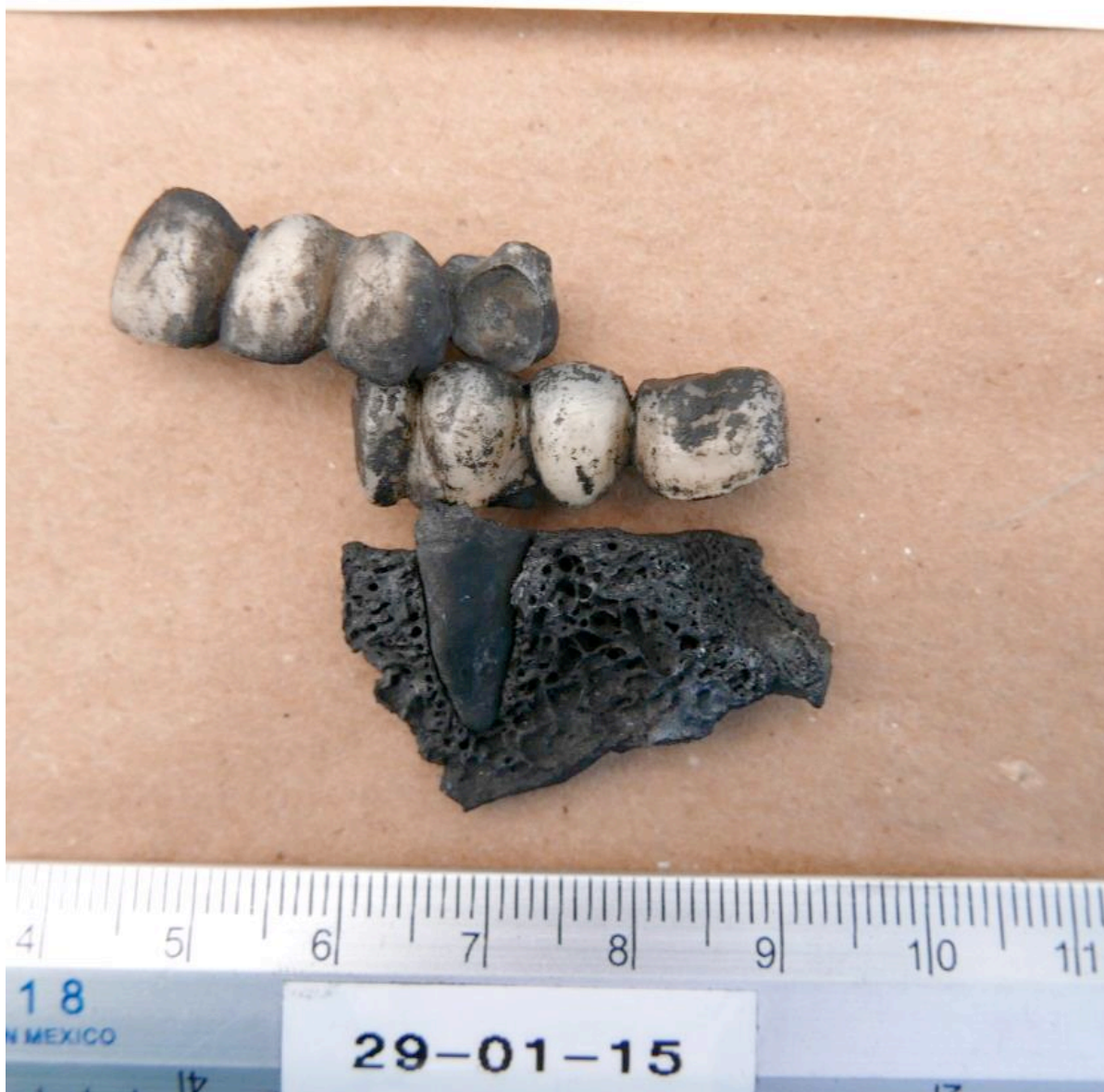
Protesis parcial Superior e Inverior hallada en la cuadrícula M8.